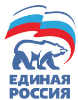
График приёма граждан в местной общественной приёмной Катав-Ивановского местного отделения партии «Единая Россия» (штаб общественной поддержки Челябинской области) на ИЮНЬ 2025 г.

Уважаемые жители Катав-Ивановского района!